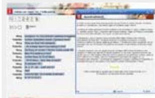
I contenuti : Approfondimento culturale