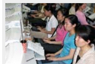
Servizi di formazione e tutoring