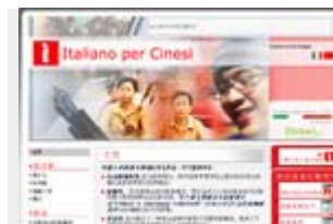
Portale bilingue di "Italiano per Cinesi"