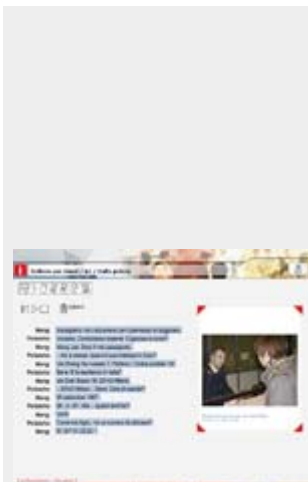
I contenuti : Un dialogo con slideshow