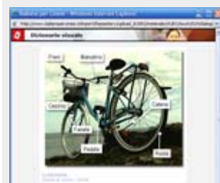
I contenuti : Dizionario visuale