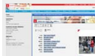
Ambiente di e-learning con interfaccia in cinese