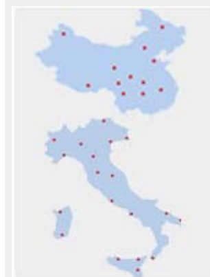
Enti di formazione linguistica e Università in Italia e in Cina